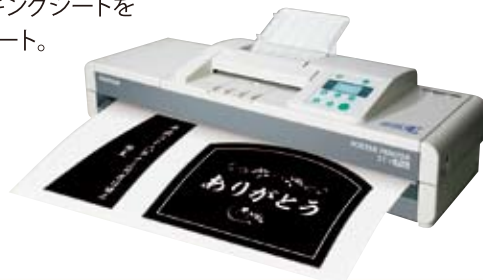
◆ FUJIFILM ポスタープリンター ST-1 かくだい君neo

新設計のサーマルヘッドの採用により、さらなる高速性と耐久性を実現。さらに、操作性、画質クオリティ・コストパフォーマンスも向上し、目的に合わせて、多様なワーキングシートをしっかりとサポート。