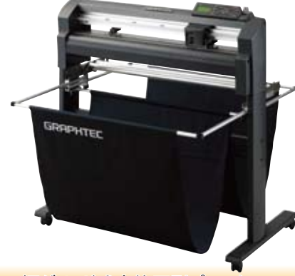
◆ 600mm幅グリッド式高筆圧型プロッター