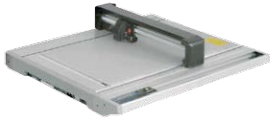
◆ A1サイズ 600×900mm フラットベッドプロッター

ゴムを切り取る機器は簡易型の巻き取り式から標準型の盤面式まで各種取り揃えています。Cutcomでは各種用途に応じて対応しています。