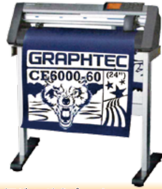
◆ 600mm幅グリッド式プロッター