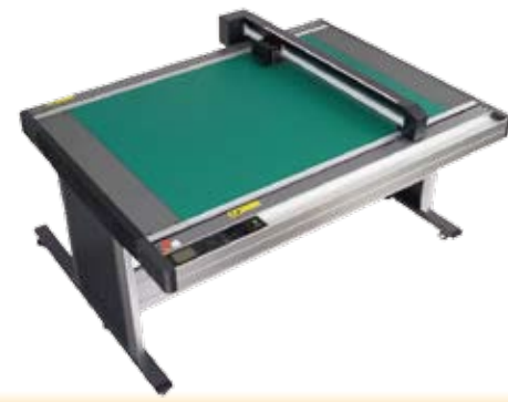
◆ A0サイズ 1200×900mm フラットベッドプロッター