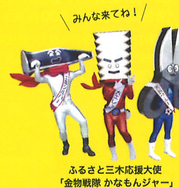
ふるさと三木応援大使「金物職人 かなもんジャー」